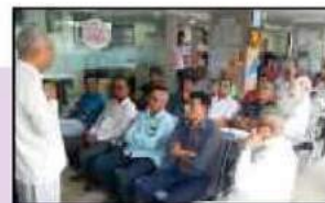
મોટા વરાછા શાખા