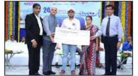
વરાછાબેંક ખાતેદાર અકસ્માત વીમા યોજના હેઠળ વારસદારને વીમા રકમનો ચેક અર્પણ કરતા બેંકના હોદ્દેદારશ્રીઓ