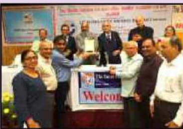
સ્કોબા તરફથી વર્ષ ૨૦૧૮-૧૯ માટે વરાછા બેંકને મળેલ પ્રોફેટીબીલીટી મેનેજમેન્ટ એવોર્ડ સ્વીકારતા બેંકના હોદ્દેદારશ્રીઓ