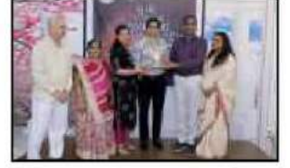
'સુખી જિંદગી જીવવાના ચમત્કારીક રહસ્યો' પુસ્તકના રસદર્શન કાર્યક્રમમાં ઉપસ્થિત લેખકશ્રી રાજપરા સાહેબનું સ્વાગત કરતા સ્થાપક ચેરમેનશ્રી તથા ચેરમેનશ્રી