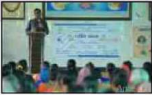
પ્રેમલક્ષ્મી મંદિર અગ્રામા ખાતે યોજેલ વડિલવંદના કાર્યક્રમ