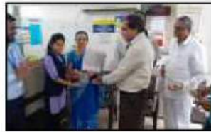
મોટા વરાછા શાખા