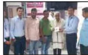
ઉંધના - પાંડેસરા શાખા