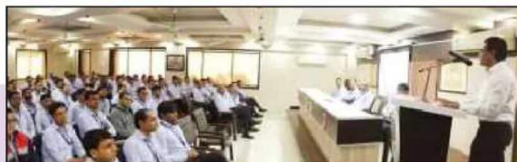
લોન અપ્રાઈઝલ અને રેશિયો એનાલીસીસ વિશે યોજેલ તાલીમમાં ઉપસ્થિત શાખા મેનેજરશ્રીઓ