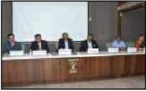
ચેમ્બર ઓફ કોમર્સ દ્વારા 'ન્યુ ચેલેન્જ્સ ઈન ડિજીટલ એજ ઈન ફાઈનાન્સ સેક્ટર' વિષય પર યોજેલ અવરનેસ કાર્યક્રમની સહાયક સંસ્થા તરીકે ધી વરાછા કો-ઓપ. બેંક લિ., સુરત