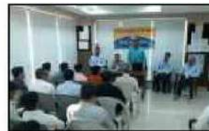
કારગીલ ચોક શાખા