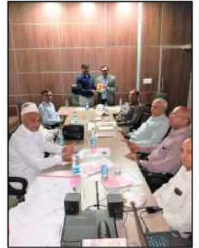
બેંકની બોર્ડ ઓફ ડિરેક્ટર્સની આઉટડોર મીટીંગમાં ઉપસ્થિત બેંકના હોદ્દેદારશ્રીઓ