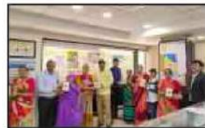
એ.કે.રોડ શાખા દ્વારા વડિલ મહિલા ખાતેદારોને પુસ્તક અને તુલસીમાળા આપીને 'મધર્સ ડે'ની ઉજવણી કરવામાં આવી