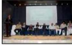
સહકારભારતી સુરત પશ્ચિમ વિભાગ દ્વારા 'સહકારીબેંકો અને કે ડીટ સાંસા મંડળીઓનું સમાજ જીવનમાં યોગદાન' વિષય પર આયોજીત સેમીનાર કાર્યક્રમ સોજન્યમાં વરાછાબેંક સહભાગી હતા તે પ્રસંગની તસવીર