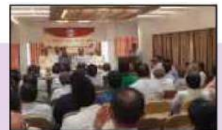
અડાજણ / પાલ શાખા