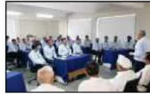
પી.પી.સવાણી યુનિ. ખાતે આયોજીત 'ટીમ બિલ્ડીંગ' વર્કશોપમાં ઉપસ્થિત શાખા મેનેજરશ્રીઓ