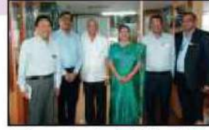
ધી વેરાવળ મર્કન્ટાઇલ કો.ઓ.બેંકના ચેરમેન, એમ.ડી. તેમજ સીઈઓ બેંકની મુલાકાતે