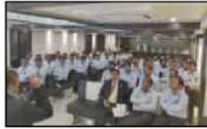
શાખા મેનેજરશ્રીઓ માટે યોજેલ ઈન્વ્યોરન્સ ટ્રેનીંગ પ્રોગ્રામ