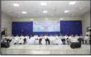
વરાછાબેંક પ્રેરીત સુરત જિલ્લા અર્બન કો-ઓપ.કેડેટ સોસા. ફેડરેશન આયોજીત 'સહકાર સંમેલન'માં ઉપસ્થિત મંચસ્થ મહેમાનશ્રીઓ. અનાથ બનેલી ટીકરીના પાલક માવતર બનનાર દંપતીનું સન્માન કરતા વરાછાબેંકના હોદ્દેદારો સાથે મહેમાનશ્રીઓ