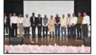
વરાછાબેંક અને સુરત નેશનલ બેંકના સંયુક્ત ઉપક્રમે યોજાયેલ 'સહકાર ગૌરવ અભિવાદન સમારોહ'માં ઉપસ્થિત સહકાર જગતના મહેમાનશ્રીઓ સાથે વરાછાબેંકના હોદ્દાદારશ્રીઓ