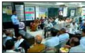
એ. કે. રોડ શાખા