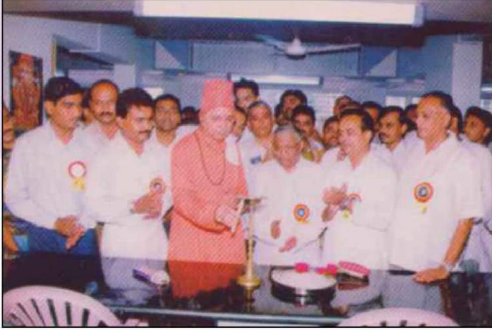
“એક ઐતિહાસીક પળ”