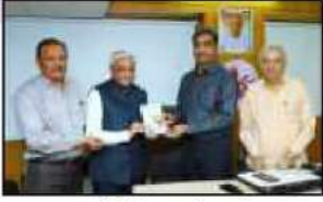
વરાછાબેંકની મુલાકાતે પધારેલા નાકકબ પ્રમુખશ્રી જ્યોતિન્દ્ર મહેતા