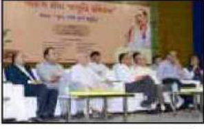
અમદાવાદ શાખા આયોજીત "બેંકિંગ સેવા જાગૃતિ સંમેલનમાં" મંચસ્થ મહેમાનો અને ઉપસ્થિત ગ્રાહકો અને મહેમાનશ્રીઓ