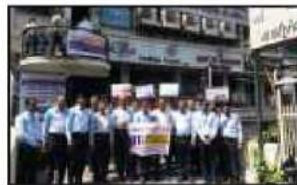
એફિલટાવર શાખા દ્વારા 'વિશ્વ તમાકુ નિષેધ દિન' નિમિત્તે વ્યસન મુક્તિ જાગૃતિ કાર્યક્રમ