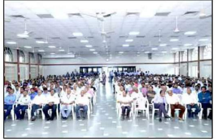
બેંકની ૨૪મી વાર્ષિક સાધારણ સભા પ્રસંગે મંચસ્થ મહેમાનો તથા મોટી સંખ્યામાં ઉપસ્થિત સભાસદો અને મહેમાનશ્રીઓ