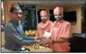
શ્રી ભાલાજી ફાઉન્ડેશન ટ્રસ્ટ સંચાલિત રૂપીકુલ ગોધન (પાનોલી)ના સ્વામીશ્રી ચેરમેનશ્રીની મુલાકાતે