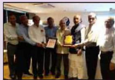
સુરત જિલ્લા સહકારી સંઘ તરફથી વર્ષ ૨૦૧૮-૧૯ માટે સહકારી બેંકોમાં શ્રેષ્ઠ કામગીરી બદલ 'પ્રથમ પ્રભાવક શિલ્ડ' સ્વીકારતા બેંકના હોદ્દેદારશ્રીઓ