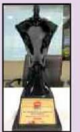
બેંકો બ્યુ રીબન સેરેમની ૨૦૧૯માં અર્બન બેંકમાં ૧૦૦૦-૨૦૦૦ થાપણ કેટેગરીમાં ભારતમાં 'ફર્સ્ટ રેન્ક'