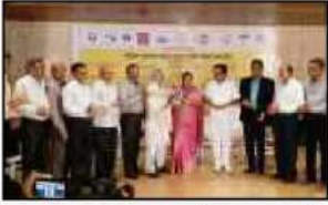
દક્ષિણ ગુજરાત સાંસદ સભ્ય અભિવાદન સમારોહમાં સાંસદ શ્રીમતી દર્શનાબેન જરદોશ અને શ્રી સી.આર.પાટીલનું સન્માન કરતા વરાછાબેંકના હોદ્દાદારશ્રીઓ